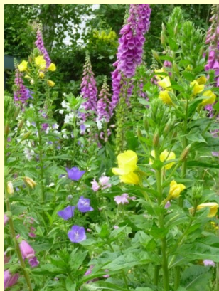
Blütenpracht im Naturgarten